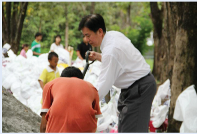
about พูดคุยและเสนอความคิดเห็นกับอธิการบดี