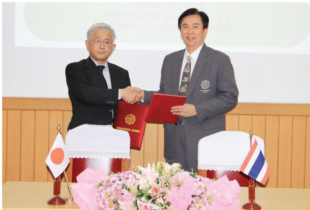
มศว - ม.เซนได

อีกทั้งยังเป็นการกระชับความสัมพันธ์อันดีที่มีต่อกันของทั้งสองสถาบัน โดยก่อนหน้านี้ทั้งสองมหาวิทยาลัยได้มีความร่วมมือทางวิชาการในด้านต่างๆ จนประสบผลสำเร็จเป็นที่น่าพอใจ และนำมาสู่การต่อยอดความร่วมมือทางวิชาการในครั้งนี้ที่จะบรรลุข้อตกลงในการแลกเปลี่ยนนิสิตทั้งสองฝ่ายรวมทั้งยังจะก่อให้เกิดการแลกเปลี่ยนคณาจารย์ต่อไปด้วย